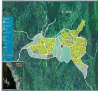
الموقع بالنسبة للمخطط الهيكل