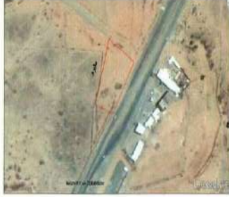
الموقع على المصور الفضائي